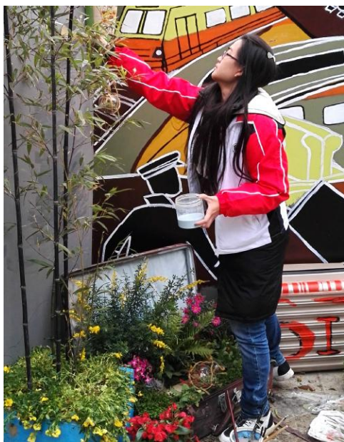
我校师生的作品在“2016 上海国际花展”的未来园艺师展示区荣获了唯一最高奖项“铂金奖”。图为赛前设计作品。

高校的政治理论课是巩固马克思主义在高校意识形态领域指导地位的重要阵地。为加强高校思政课建设，中宣部、教育部联合印发《普通高校思想政治理论课建设体系创新计划》，指出要重点建设一批教学科研皆强的马克思主义学院。学校以此为契机在原马克思主义教育部的基础上设立马克思主义学院。(下转第3版)