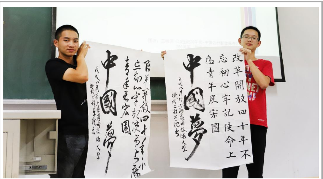
(我校机械学院举办“改革开放40周年”暑假团日活动答辩。图为同学们通过书法作品寄予对改革开放四十周年的真情祝福,表达出新时代青年肩负创造未来的使命感和荣誉感。)

经典诵读活动以传承弘扬中华优秀传统文化为宗旨,以“经典诵读”临时党支部为抓手,旨在提升我校学生的人文素养和艺术修养,树立大学生的文化自觉和文化自信,营造良好的校园文化环境。(人文学院 供稿)