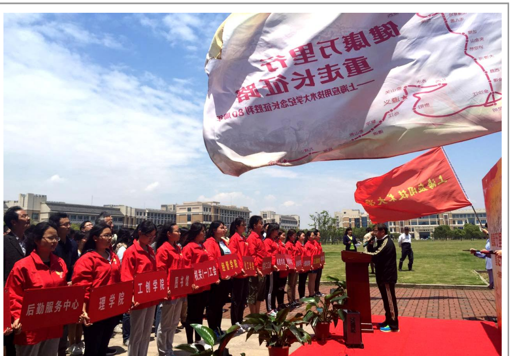
今年是中国工农红军长征胜利80周年。为弘扬长征精神, 学校举行“健康万里行, 重走长征路”主题健步走活动。活动采取虚拟重走长征路的形式, 通过队员每天健走, 用近6个月的时间走完“长征路”。