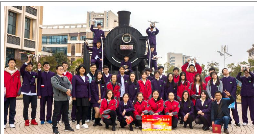
3月10日上午,杨思高级中学2017届高三学生成人仪式暨高考百日冲刺动员大会在我校奉贤校区举行。图为学生在火车头广场前合影。

环保节能教学的实践场所。学院与闵行中学进行深入沟通交流,达成合作意向,即提供特色专业的学术类讲座,协助开展“桥梁结构设计建造及美化”的美国伯克利大学暑期项目,并指导其研究性学习课题小组。