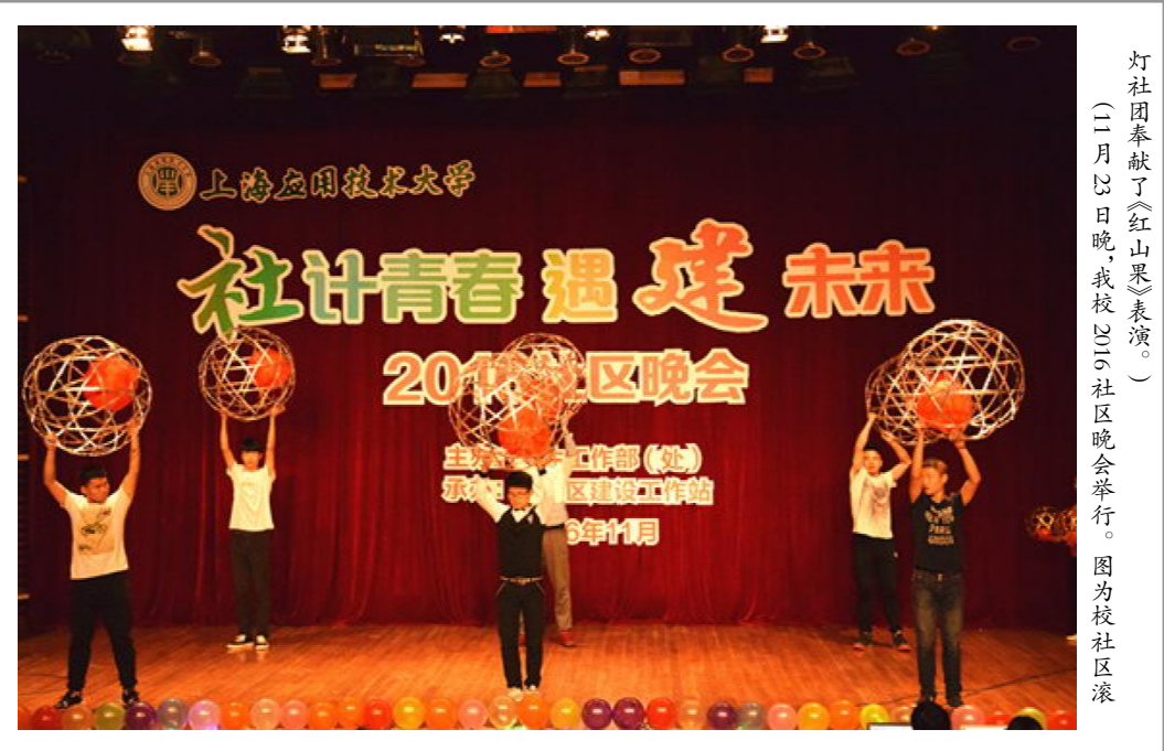
灯社团奉献了《红山果》表演。(二月廿日晚,我校社区建设工作站社区晚会举行。图为校社区滚

一位身穿汉服的姑娘一出场,便闻扑鼻的柔情与娇俏,每一步,每一回眸,都令观者仿佛重回千年前。唐风精巧,锦衣青袖,霓裳羽衣在舞台流转;轻盈体态,音容相貌,谈笑间将人拉回盛世大