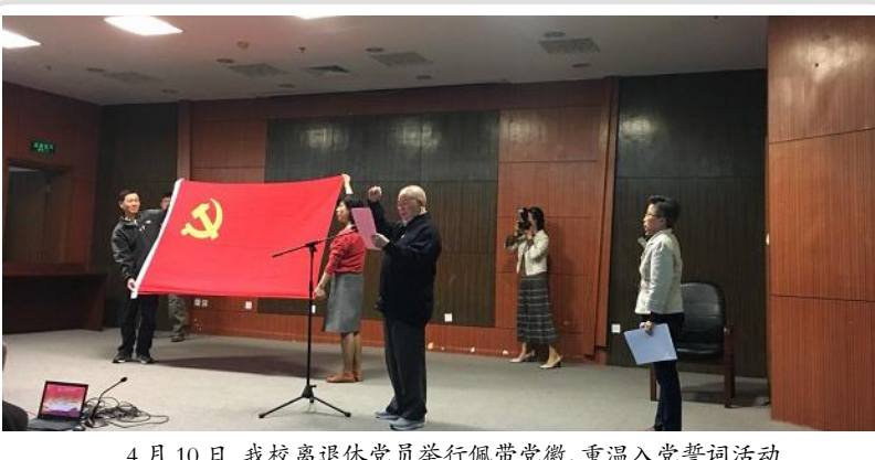
4月10日,我校离退休党员举行佩戴党徽、重温入党誓词活动

会议研讨了2018年中加师生交流项目及分会2018年重点工作。各与会高校交流了国际化发展经验。(国际交流处供稿)