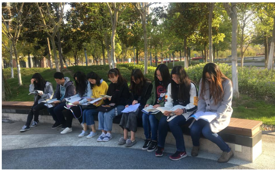
最是一年春好处,校园里最美的一幕,应该是清晨手捧一本书细细品读的上应学子们。