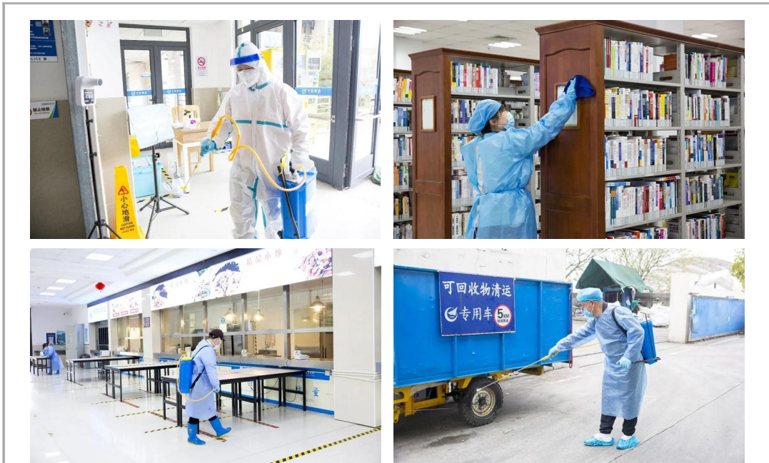
为进一步加强校园疫情防控,降低疫情传播风险,4月初,学校成立消杀工作专班,组建由专业消杀和物业后勤保洁相结合的消杀队伍,对奉贤校区和徐汇校区开展全范围、分层次、分等级的专业环境消杀,确保做到全覆盖、无死角、无盲区、无空白。截止到4月22日,学校共出动消杀人员1366人次,日均消杀点位77个。