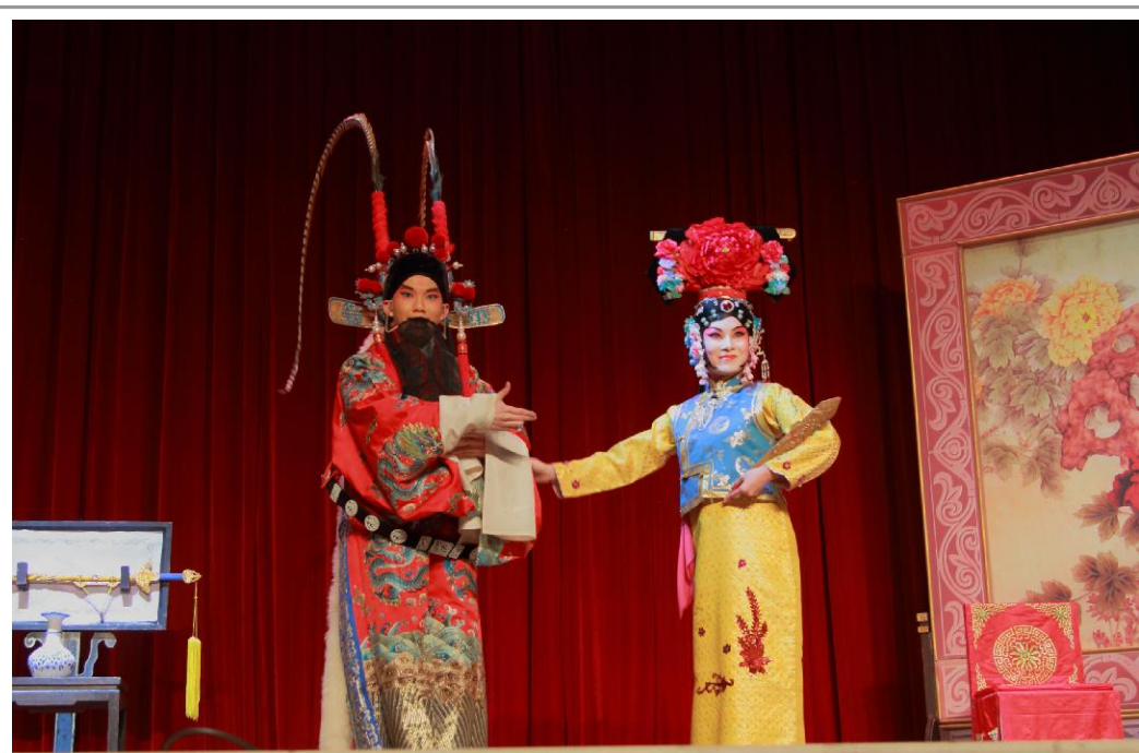
12月7日晚,由上海淮剧艺术传习所带来的淮剧经典折子戏在我校精彩上演。

金华工业科技合作洽谈会始于1999年,是浙江省起步最早、举办届数最多科技洽谈会,已经逐步形成了“政府搭台、企业唱戏、院所依托、社会参与”的模式,目前已经成为金华乃至周边地区的科技合作盛会。浙江日报、科技金融时报等多家媒体对此次我校与金华的全面合作进行了报道。