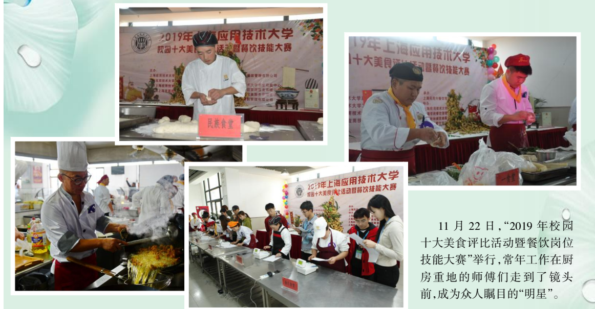
11月22日,“2019年校园十大美食评比活动暨餐饮岗位技能大赛”举行,常年工作在厨房重地的师傅们走到了镜头前,成为众人瞩目的“明星”。