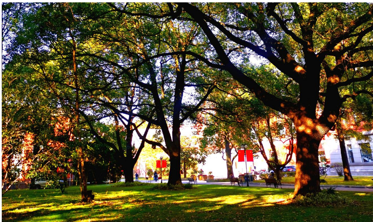
秋意继续

走在上应大的小路上，幻想着在今后四年的时光里，能够在此留下属于自己的印迹。在这里，我将为青春呐喊，为理想奋斗，为成为一名优秀的大学生而释放全部的激情。前路漫漫，未来的路，无畏“小别离”，愿充满“小欢喜”，进取而美好。